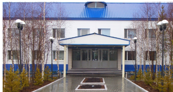
«Шлюмберже Лоджелко Инк.»