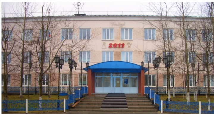
ОАО «Сервисная Транспортная Компания»