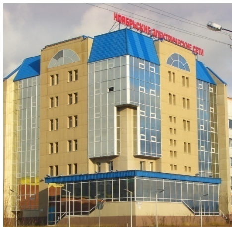
ОАО «Ноябрьские электрические сети»