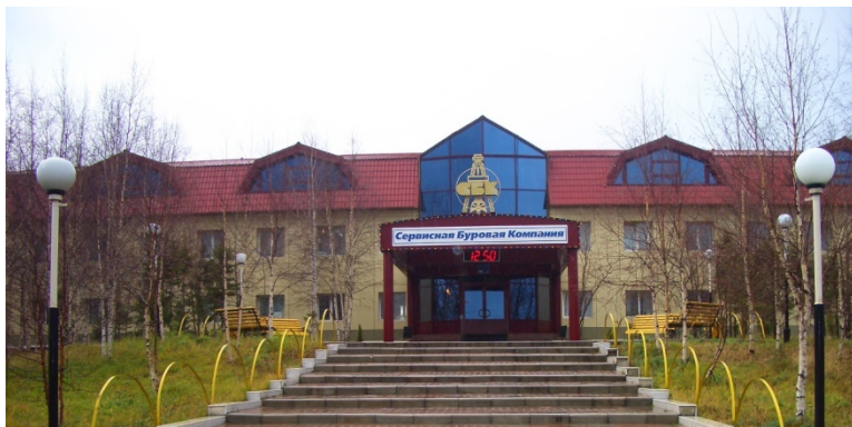
ООО «Сервисная буровая компания»